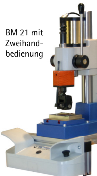
BM 21 mit Zweihand- bedienung

*) Diese Angaben sind grobe Richtwerte. Genaue Ergebnisse sind nur durch einen Prägeversuch zu ermitteln. Technische Änderungen vorbehalten.